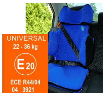
FOTELIK SAMOCHODOWY CAR SAFETY SEAT