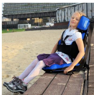
SIEDZISKO ORTOPEDYCZNE ORTHOPAEDIC SEAT