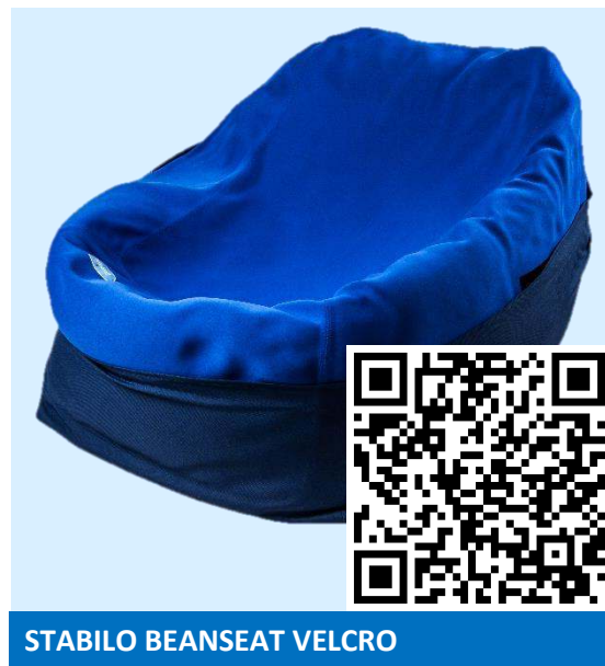
STABILO BEANSEAT VELCRO

Znajdź PODUSZKI STABILO na: / Find STABILO CUSHIONS on: